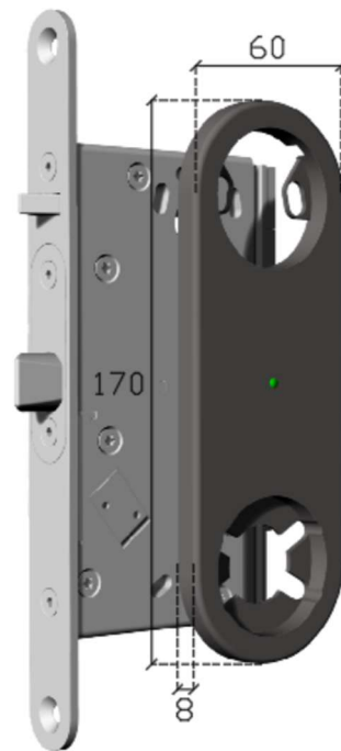
Måttsättning läsarenhet (mm)